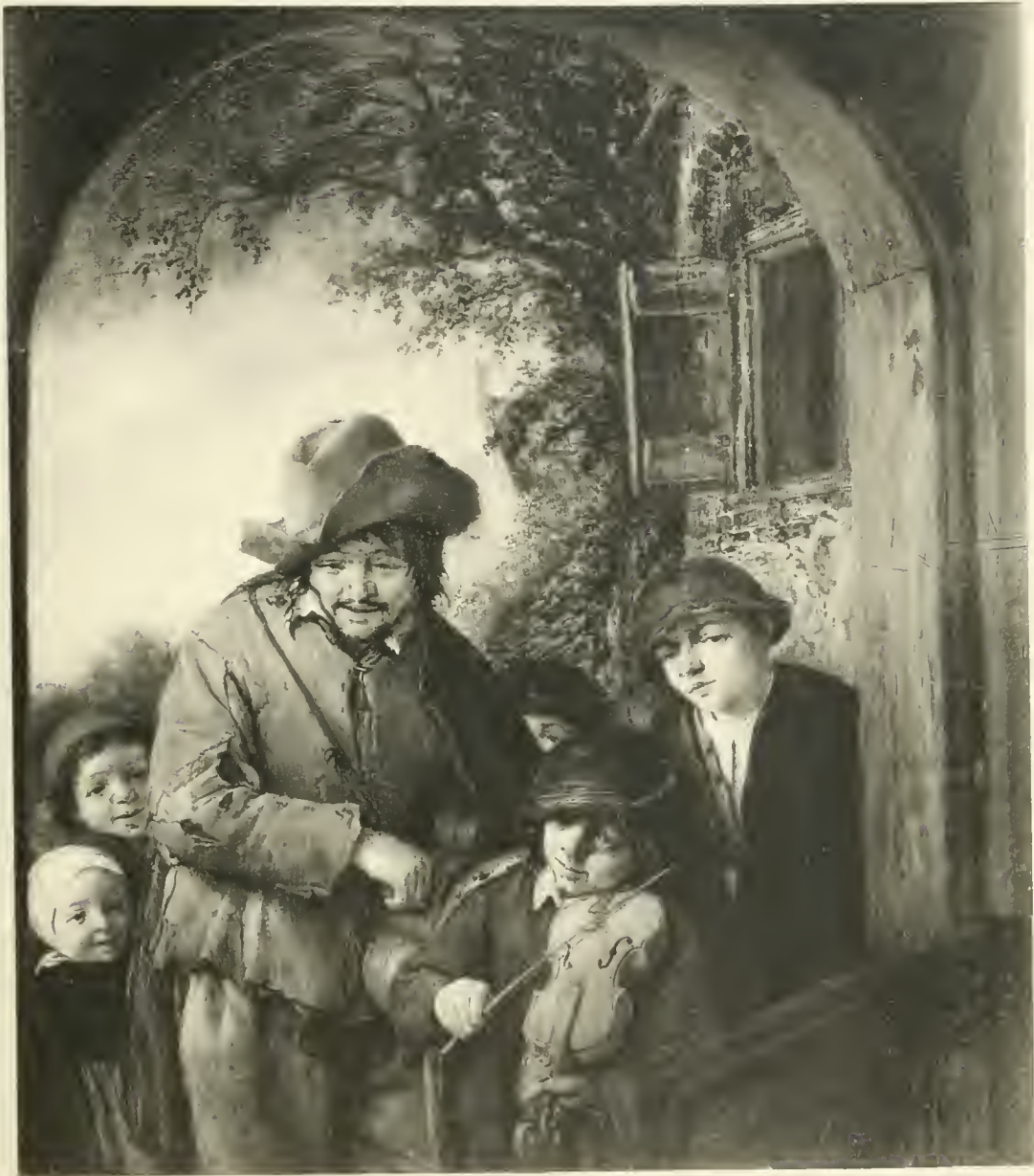
A VAN OSTADE

TERCENTENAIRE DE REMBRANDT - EXPOSITION FREDERIK MULLER & CIE